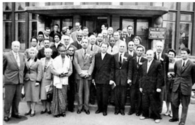
Семінари ВООЗ (липень та жовтень 1965 р.) у м. Харкові