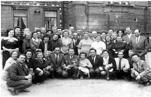
Колектив інституту, 60–70 роки