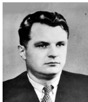
Задорожний Борис Якимович (1923 – 1993 рр.)

У перші повоєнні роки співробітники Інституту працювали на санітарно-пропускних пунктах Львівського військового округу під час прийому репатрійованих громадян з метою проведення медичних оглядів населення, виїжджали у тривалі експедиції до західних областей України. Так, у 1948 р. співробітниками інституту проведено масове обстеження сільського населення 100 районів УРСР.