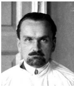
Федоровський Олександр Миколайович (1890–1963 рр.)